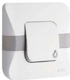
EC006 / EC007